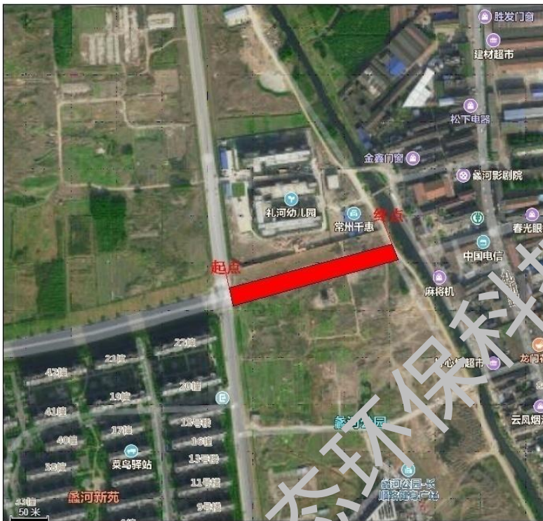
图 2-1 长汀路（锦润路-蠡河）地理位置及线路走向图

长汀路（锦润路-蠡河）工程位于常州西太湖科技产业园，该道路呈一条直线，沿线不跨越河流，不涉及桥梁建设，道路西北方规划为二类居住用地，道路南侧规划为公园绿地，具体项目地理位置及线路走向图见 2-1。