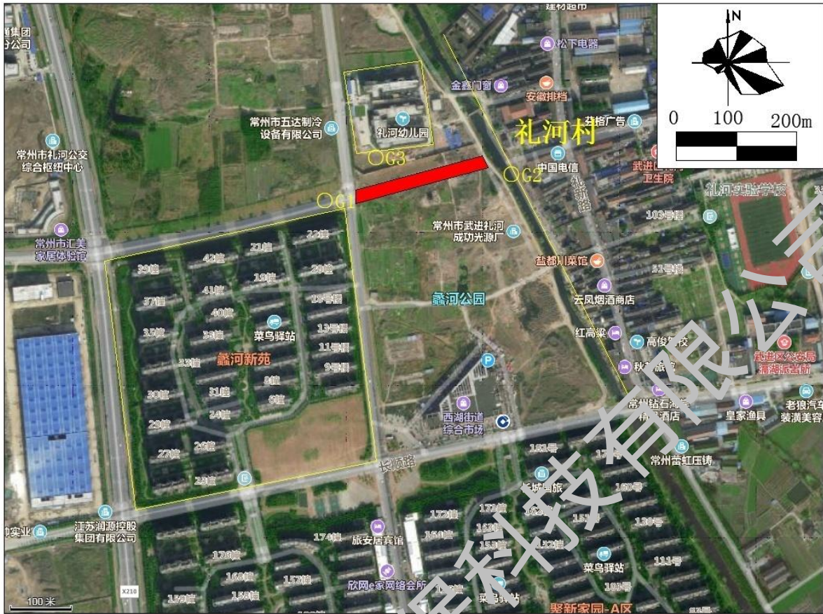
图 8-1 长汀路敏感点环境空气监测点位图