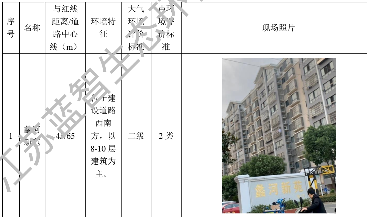
表 1-7 大气环境、声环境保护目标一览表